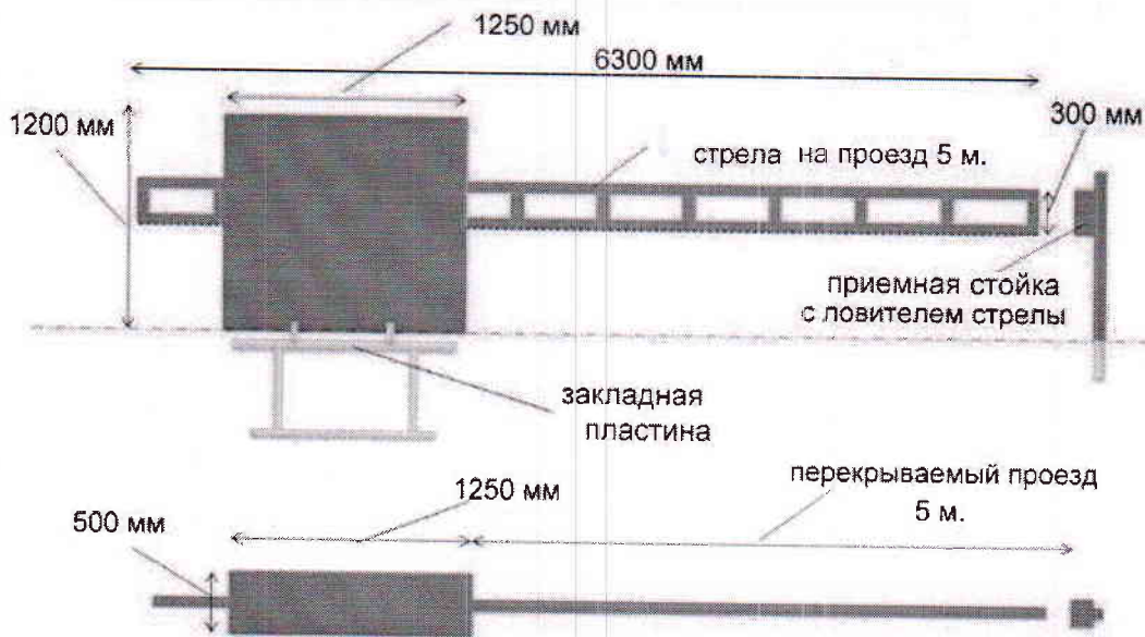
Рис. 2. Габаритные размеры