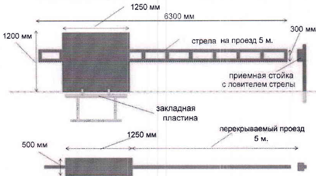
Рис. 2. Габаритные размеры