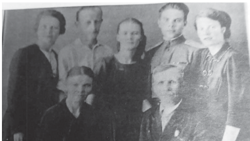
Май 1945 года. Мои близкие родственники собрались вместе после окончания войны. Они худые, изможденные, но лица светлые, это лица победителей

Как-то в мои школьные годы папа взял меня в командировку на завод в районе Капотня. Папа был инженером-изобретателем, и его приборы использовались на многих заводах Москвы. На мой вопрос о том, что он делал в военные годы во время эвакуации, он ответил просто: «Мы с твоей мамой работали». Медали родителей «За доблестный