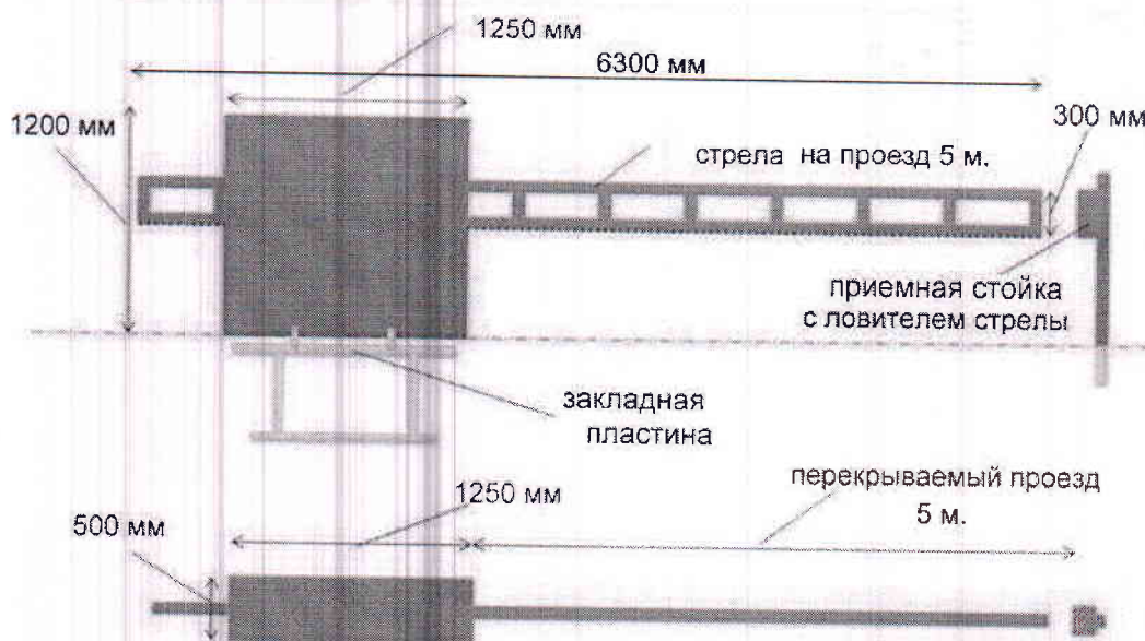
Рис. 2. Габаритные размеры